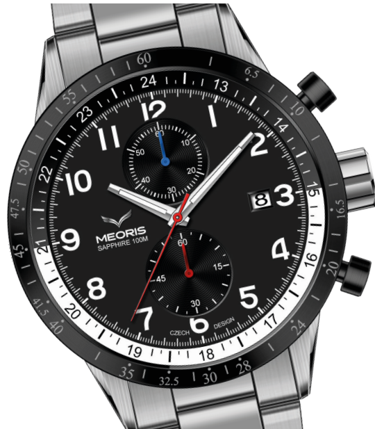
EXPLORER SB, NB, BB